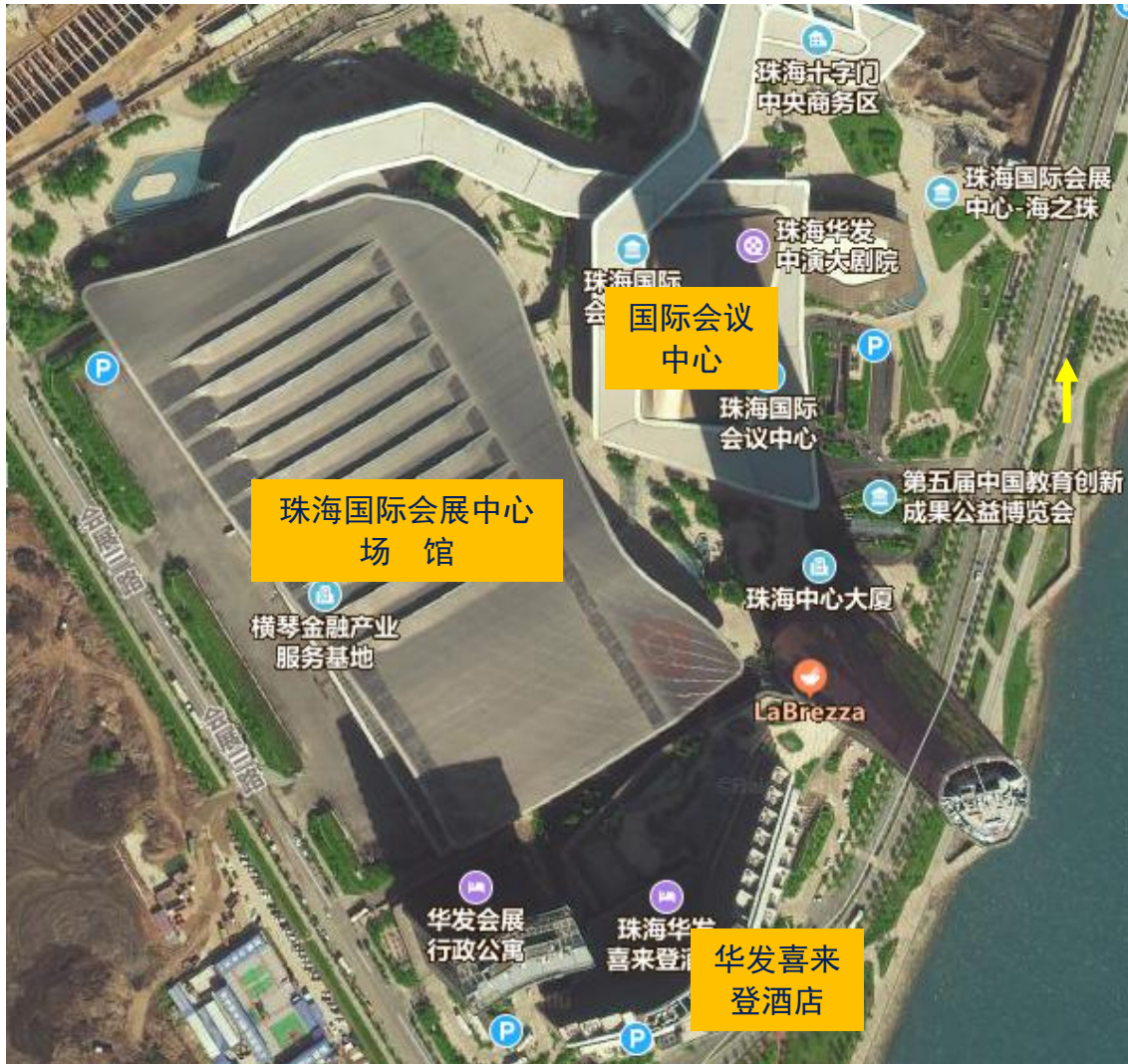
珠海国际会展中心及其周边地形图

本届年会鉴于会场条件和分会数量大,按目前规划,各分会分布将占用三处场地:珠海国际会展中心内的会议室、珠海国际会议中心内大部分的会议室、华发喜来登酒店内的部分会议室。分会会场的具体分布和安排尚未确定,需等会议征稿截止后才能开始着手安排。