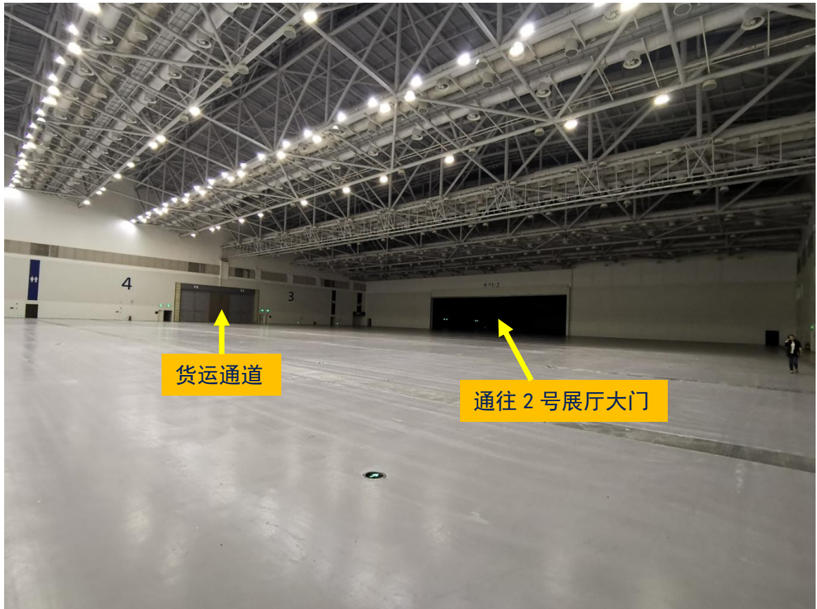
珠海国际会展中心 3、4 号展厅（本届展览所在）照片 图中通往 2 号展厅的通道，左侧为打开后的状况，右侧为封闭时的状况，左右两侧均从第二天开始打开。