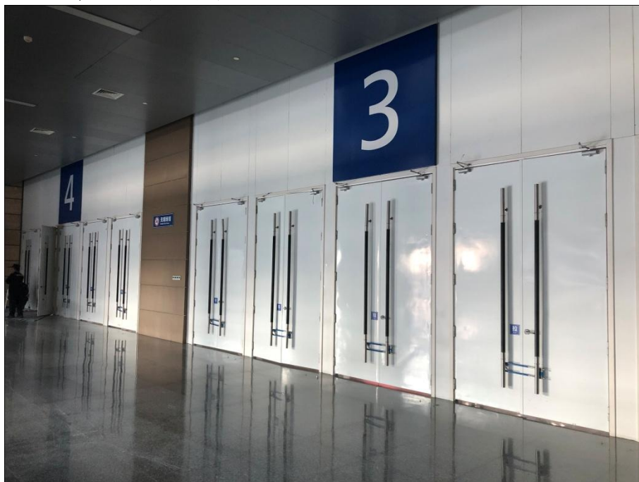
3、4 号展厅 入口大门照片